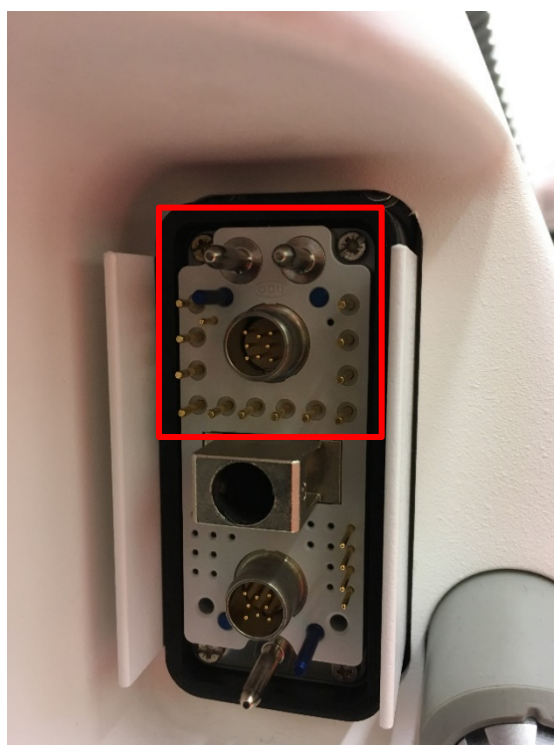
slika 2: primjer područja s kontaktima priključka X10 koje se ne smije doticati