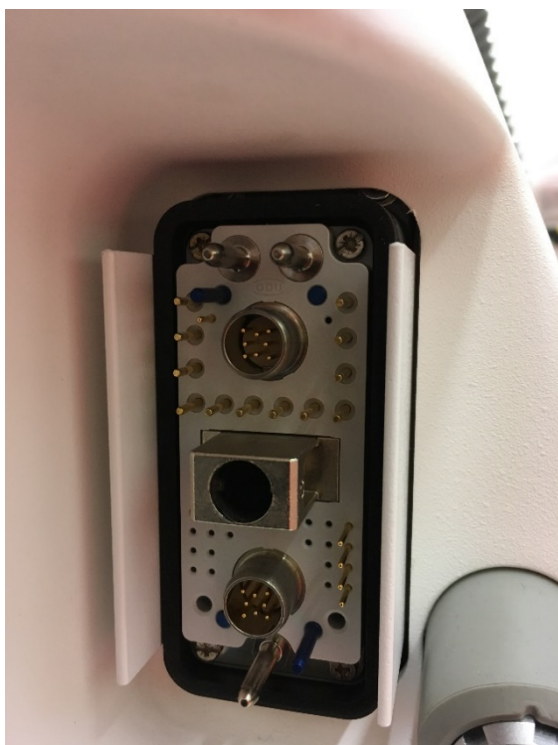
slika 3: primjer priključka X10 u koji nije priključen utikač glavnog kabela