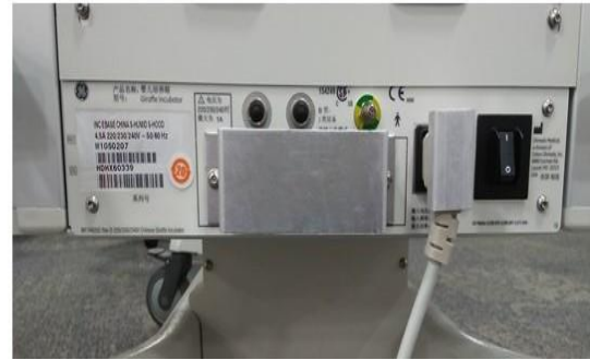
slika 3: Servo modul kisika NIJE instaliran