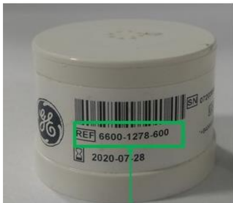
Slika 5: Broj dijela za senzor kisika: 6600-1278-600