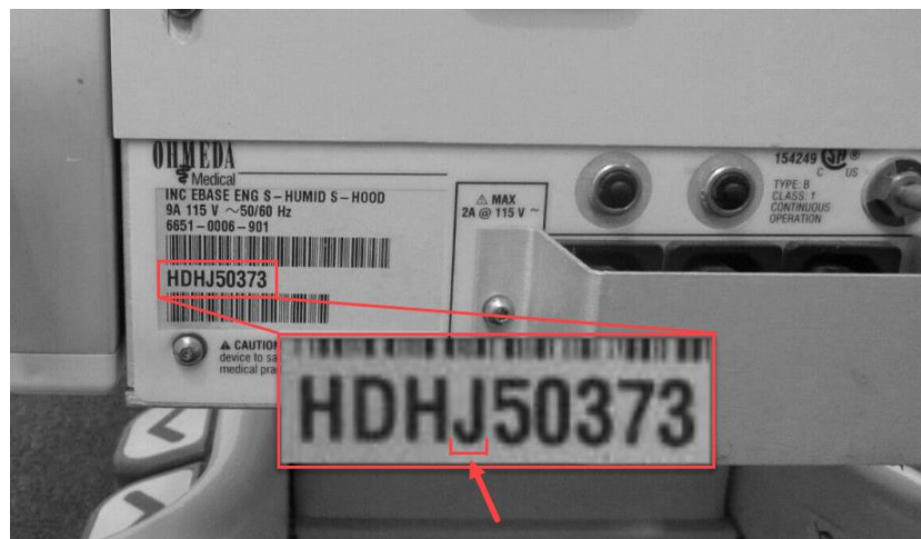
Slika 1: Oznaka sa serijskim brojem, lokacija 4. slova