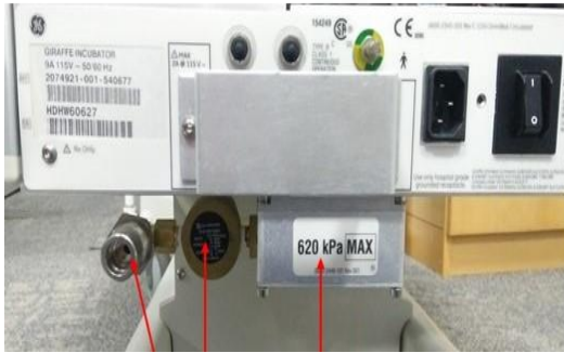
Slika 2: Servo modul kisika je instaliran