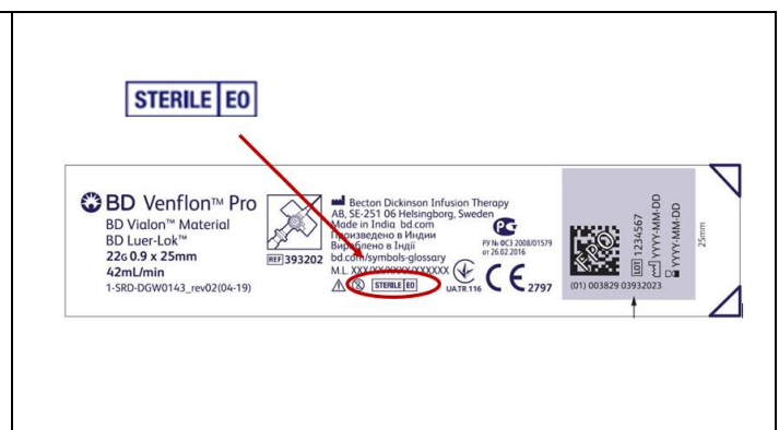
Slika 2: Reprezentativna slika oznake na proizvodu na kojoj je naznačena metoda sterilizacije etilen-oksikom (EtO)