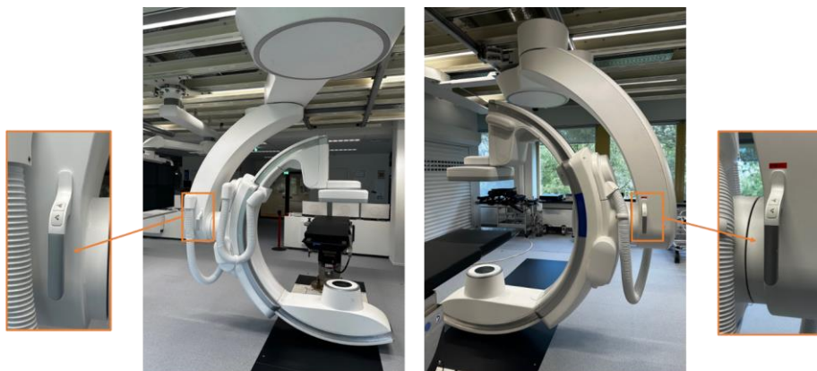
Slika 3: Ručka s kontrolama kočnica na obje strane postolja FlexArm

Napomena: ručno uzdužno pomicanje uvijek je dostupno putem ručki i kontrola kočnica s obje strane nosača FlexArm (Slika 3).