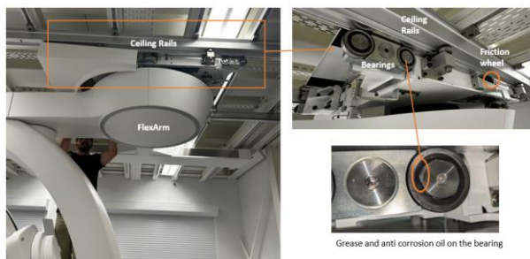
Slika 2 Pregled elemenata nosača FlexArm i identifikacija problema

Tvrtka Philips utvrdila je da uzdužno motorizirano pomicanje nosača FlexArm može biti nedosljedno (ne uglađeno) i da u konačnici može postati nedostupno. Taj je problem uzrokovan curenjem maziva iz ležajeva i/ili ulja protiv korozije na ležajevima, zbog čega podmazivanje na stropnoj vodilici može biti prejak, smanjujući trenje između vodilica i tarnog kotača (pogledajte Sliku 2).