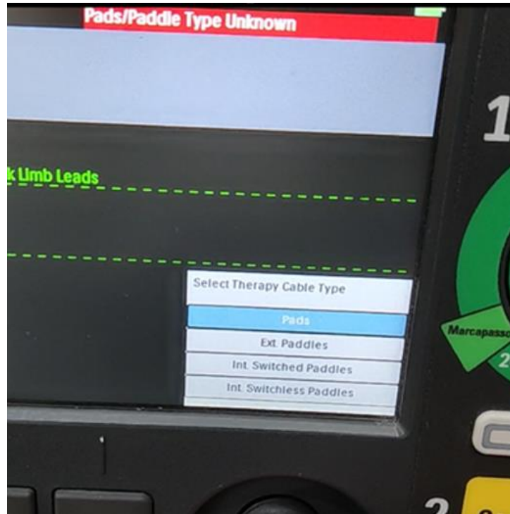
Slika 1: Prikaz aslona uređaja DFM100 koji ima problema s pogrešnom identifikacijom elektroda.