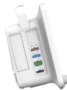
B1x5P bez dodatnog utora za E-modul