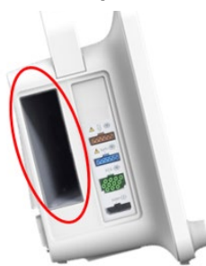
B1x5P s dodatnim utorom za E-modul i B1x5M