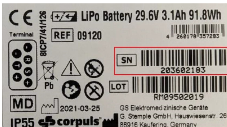
Slika 1: nazivna pločica baterije corpuls cpr (LiPo) REF 09120

Oznaku tipa i raspon serijskih brojeva možete pronaći na nazivnoj pločici baterije corpuls cpr.