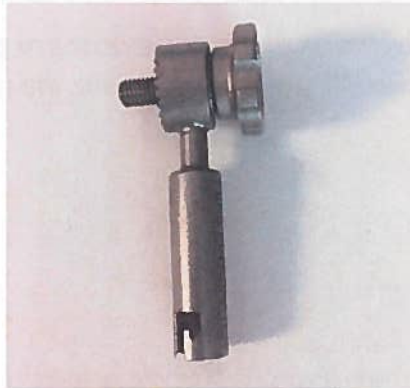
Samo adapter je zahvaćen, ne cijeli sklop