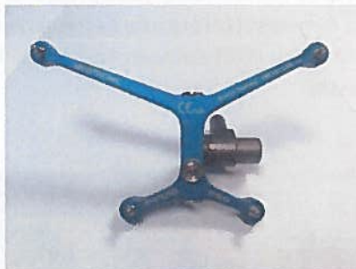
Plavi perkutani referentni okvir (9732353)

Ova obavijest je namijenjena za zabilježbu ove situacije u vašoj evidenciji. Molimo vas da se ovo pismo dostavi svima onima koji trebaju biti svjesni ovog problema unutar vaše ustanove odnosno bilo kojoj ustanovi gdje je zahvaćeni proizvod mogao biti dostavljen.