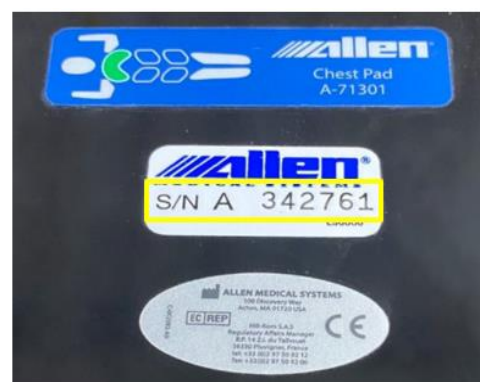
Slika. 2. Naljepnica sa serijskim brojem