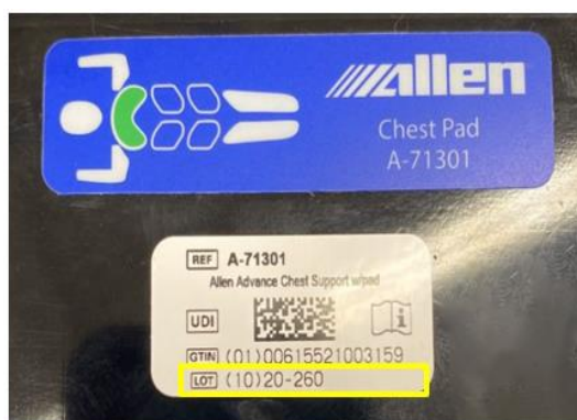
Slika. 1. Naljepnica s brojem serije