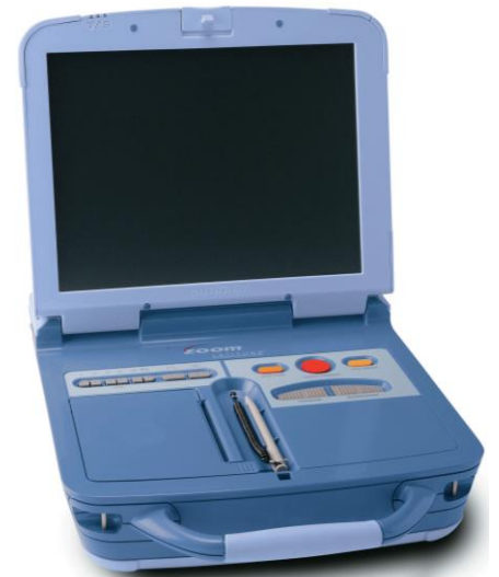
Slika 1. Programator Model 3120 ZOOM