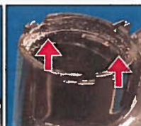
Prsten za učvršćivanje pumpe NEDOSTAJE

Slika: Lokacija prstena za učvršćivanje na MiniMed™ inzulinskoj pumpi serije 600