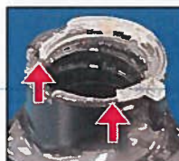
OŠTEĆENI prsten za učvršćivanje pumpe