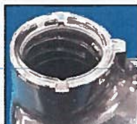
NORMALNI prsten za učvršćivanje pumpe

Slike prikazuju normalni prsten za učvršćivanje pumpe u odnosu na onaj koji je oštećen ili nedostaje.