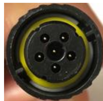
Slika 1 - Bočni prikaz konektora napajanja